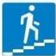
Знак 6.7. Надземный пешеходный переход

Если нет подземного или надземного пешеходного перехода, можно перейти по наземному пешеходному переходу