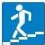
Знак 6.6. Подземный пешеходный переход