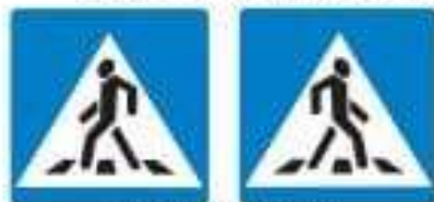
Знаки 5.19.1 и 5.19.2 Пешеходный переход

Если нет подземного или надземного пешеходного перехода, можно перейти по наземному пешеходному переходу